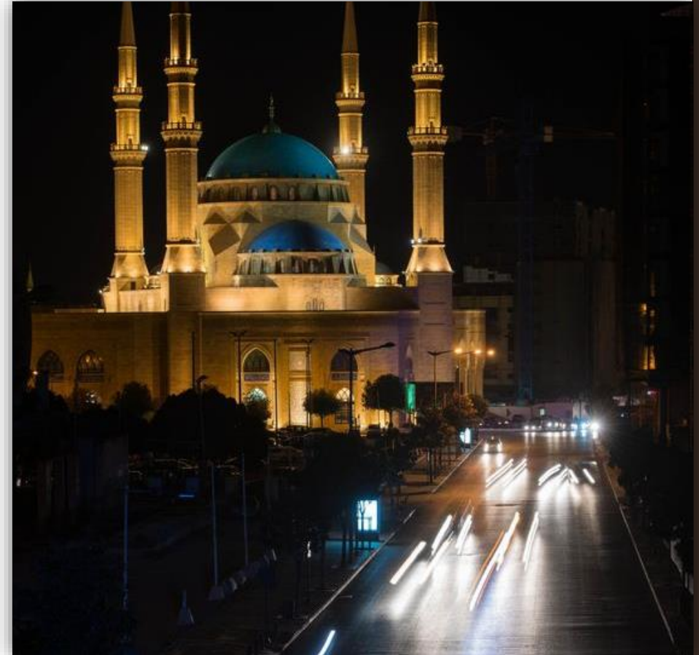
Beyrouth by night