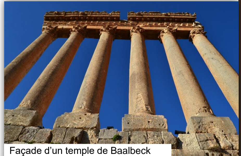
Façade d'un temple de Baalbeck