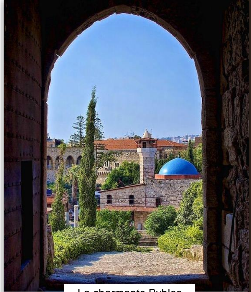
La charmante Byblos