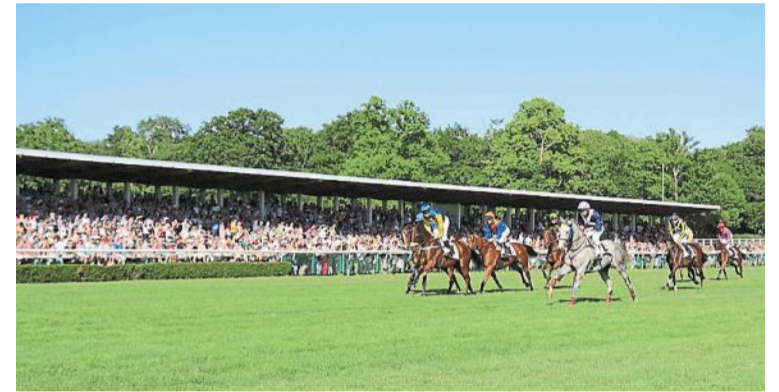
Huit courses sont au programme demain à l'Isle-Briand.

Le prochain rendez-vous de la Société des courses du Lion-d'Angers a lieu demain dès 11 heures. Huit courses sont au programme : six épreuves de plat et deux de saut d'obstacles dont le Prix du Piano de la Juiverie, steeple-chase cross-country sur 4 500 mètres pour chevaux de 5 ans et plus.