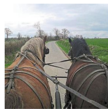
Le Segréen vu d'un attelage.