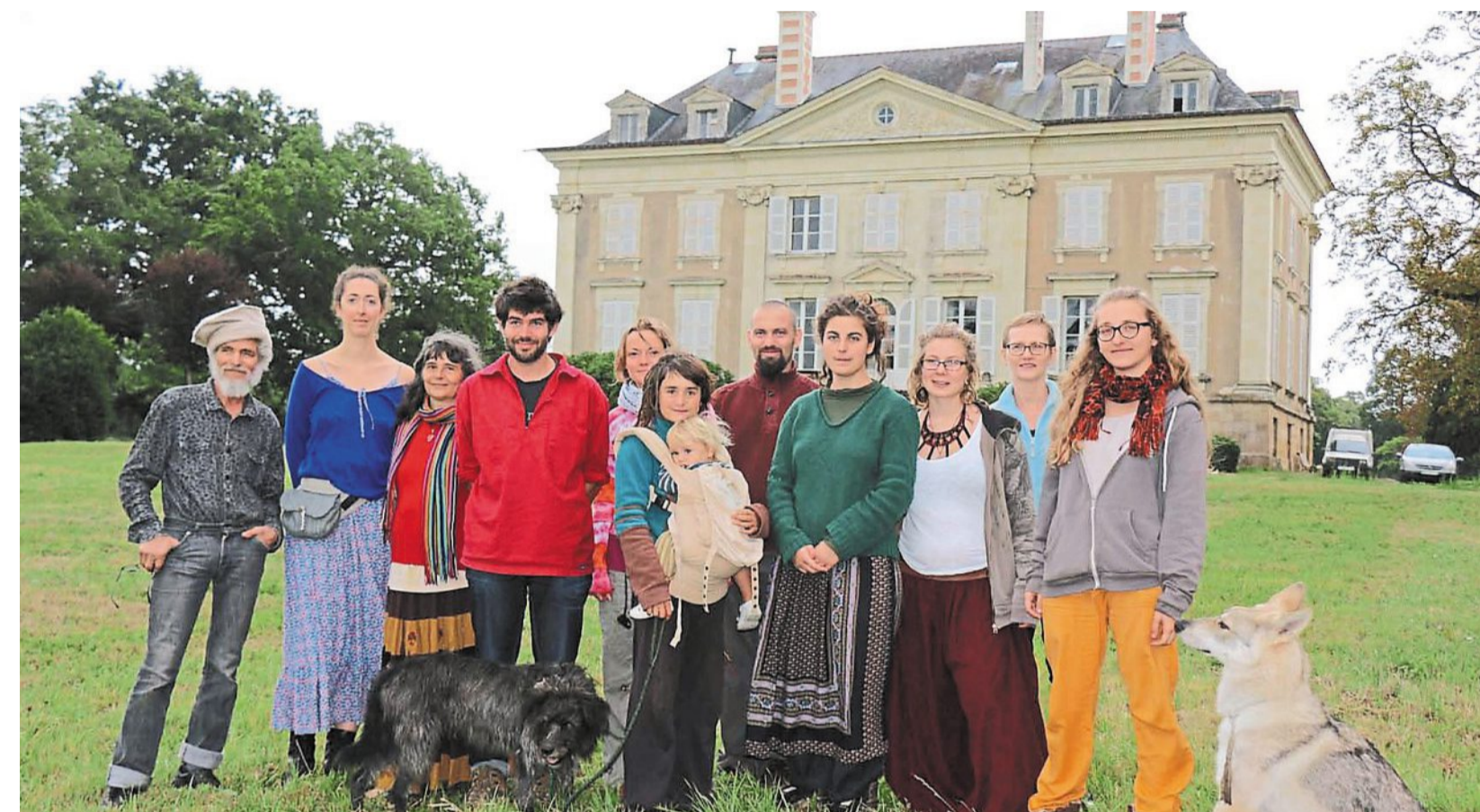
Saint-Martin-du-Bois, jeudi. « C'est le cadre exceptionnel qu'on cherchait depuis des années », se réjouissent les organisateurs du 7 e festival L'Arbre qui marche.

L'Arbre qui marche enrachine son esprit écolo-culturel en Segréen. Après Vergennes il y a un an, l'écofestival sans alcool plante son campement au Château de Danne, à Saint-Martin-du-Bois.