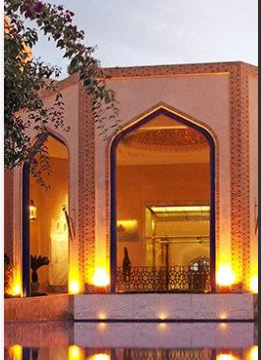
L'hôtel Es Saadi

Il est à noter que ce programme est prévisionnel et susceptible d'évoluer jusqu'à la date du départ. Les photos sont non contractuelles.